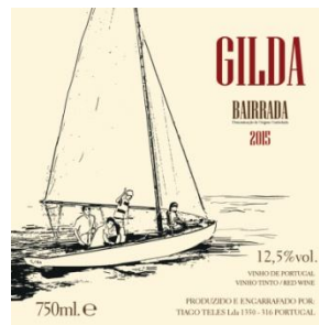
Raiz e gil da 2015 di Tiago Tel is