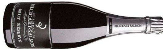
BILLECART SALMON IN MAGNUM