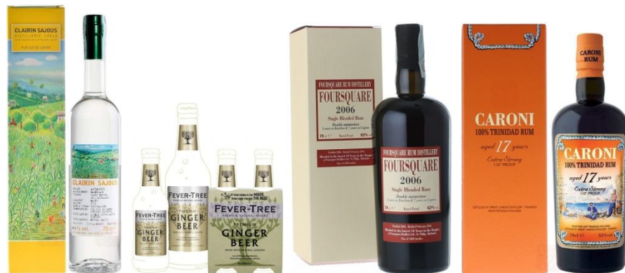
White Storm con CLAIRIN SAJOUS E GINGER BEER RUM TRINIDAD CARONI 17 YO A 55 GRADI RUM FOURSQUARE 2006 A 62 GRADI